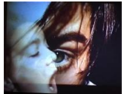
Danse et Toile