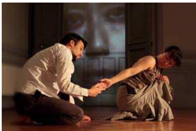
Version Galerie d'Art

Une version du projet (avril 2009) est visible, sous forme d'extraits vidéo à l'adresse : http://www.k-danse.net/echoroom