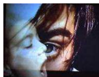
Danse et Toile