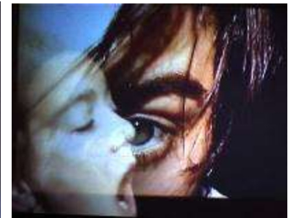
Danse et Toile