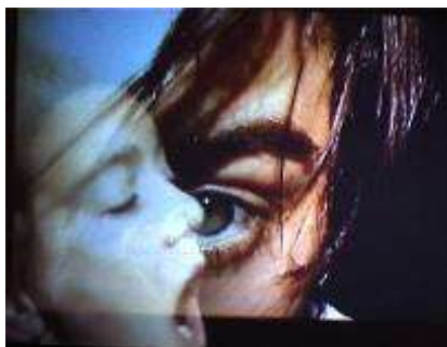
Danse et Toile