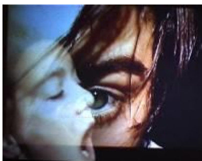
Danse et Toile