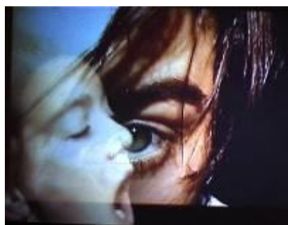
Danse et Toile